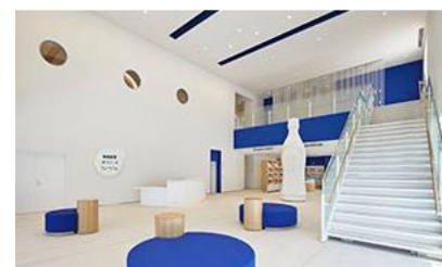
△「カルピス 未来のミュージアム」